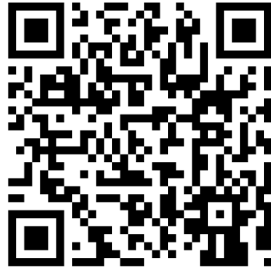
QR-Code Meine Umwelt-App

Weitere Informationen zur Asiatischen Hornisse und wie sich die Art von heimischen Insekten unterscheiden lässt finden sich auf der Homepage der LUBW https://www.lubw.baden-wuerttemberg.de/natur-und-landschaft/asiatische-hornisse sowie auf der Homepage der Landesanstalt für Bienenkunde der Universität Hohenheim unter https://bienenkunde.uni-hohenheim.de/vespavelutina . Dort finden sich auch weitere Informationen, wie Bürgerinnen und Bürger aktiv bei der Suche nach Tieren und Nestern mitwirken können. Seit April 2024 koordiniert die Landesanstalt für Bienenkunde in Stuttgart-Hohenheim im Auftrag der Naturschutzverwaltung das landesweite Management der Asiatischen Hornisse (Kontakt siehe Homepage).