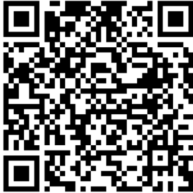
QR-Code Meldeplattform Asiatische Hornisse

Württemberg. Dies ist über die Meldeplattform auf der Homepage der Landesanstalt für Umwelt (LUBW), aber auch über die kostenlose „Meine Umwelt-App“ möglich: