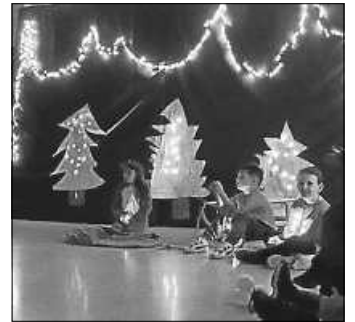
Frodos Wichtelzauber

Wir bedanken uns ganz herzlich bei der Bücherei, dem Schulchor, der Lichtenbergschule und beim Kindergarten Gehrnhorn.