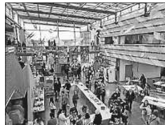
Tag der offenen Tür 2024

Am 13. Januar 2025 haben die Kinder der Klassen 4 aus den Grundschulen die Möglichkeit, in das vielfältige Schul- und Unterrichtsleben an der Erich Kästner Realschule in Steinheim hineinzuschnuppern. Die Kinder treffen sich um 14 Uhr in der Aula der Realschule und können dann ein buntes Programm zu verschiedenen Angeboten und Fächern der EKRS kennenlernen.