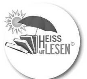
Logo: HEISS AUF LESEN©

Interessiert? Dann komm vorbei und melde dich an! Natürlich wollen wir uns auch dieses Jahr mit euch über die Bücher, die ihr gelesen habt, unterhalten. Wir sind schon ganz gespannt!