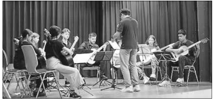
Auftritt des Gitarrenensembles beim Konzert in Murr am 05.07.2024